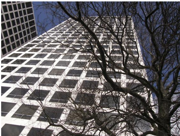
Kantoor Rotterdam (dS+V)