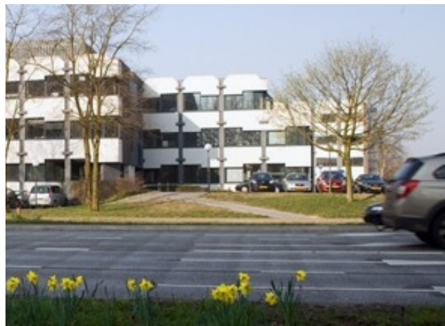
Kantoor Ede (Stadswerk)