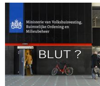
Entree VROM Den Haag

Ook de projectsubsidies vanuit VROM / WWI staan zwaar onder de druk door de bezuinigingen op de rijksuitgaven. Wat is echter onze vereniging zonder projecten, gericht op kwaliteitsverbetering van ons werk en van het gebouwde resultaat in ons land? De uitgaven blijven en zullen door kostenstijging toenemen. In bijgaand begrotingsvoorstel zoeken we enige compensatie hiervoor door opbrengsten uit bijeenkomsten eenmalig met €10.000 en vervolgens jaarlijks met 1 % te verhogen. Dit impliceert dat voor sommige bijeenkomsten in het vervolg betaalde toegang geldt.